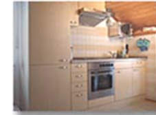
Küchenzeile mit Essecke